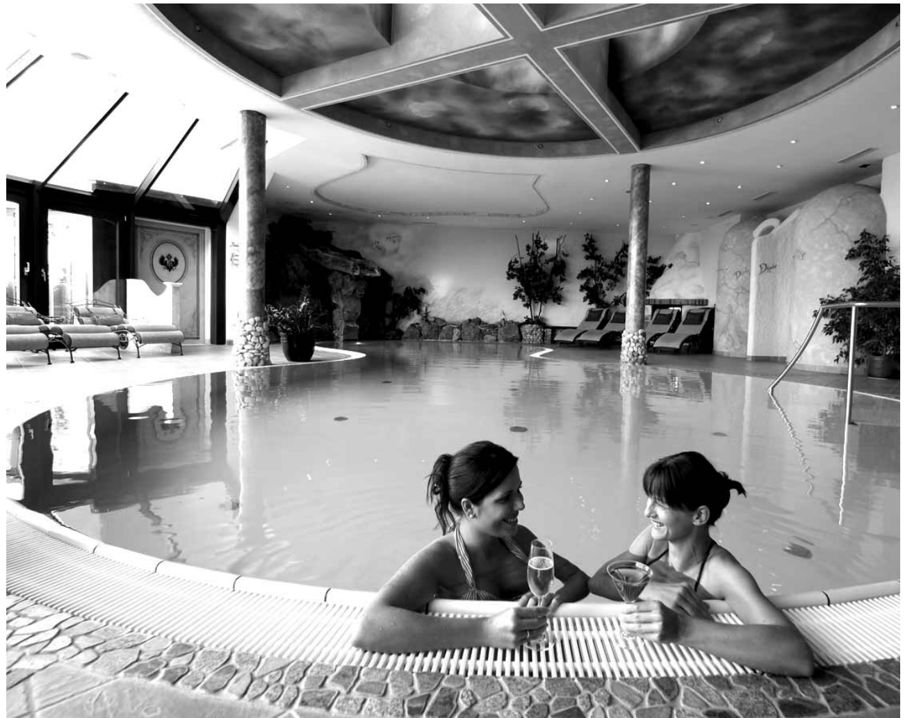
Luxus, Wellness, Fitness: Die Ferien- und Sportzentrum Hoch Ybrig AG möchte ihr Angebot erweitern und sucht einen Investor.

Sommer-Saison forcieren Mit einem neuen Hotel im Ybrig würde der regionale Tourismus einen