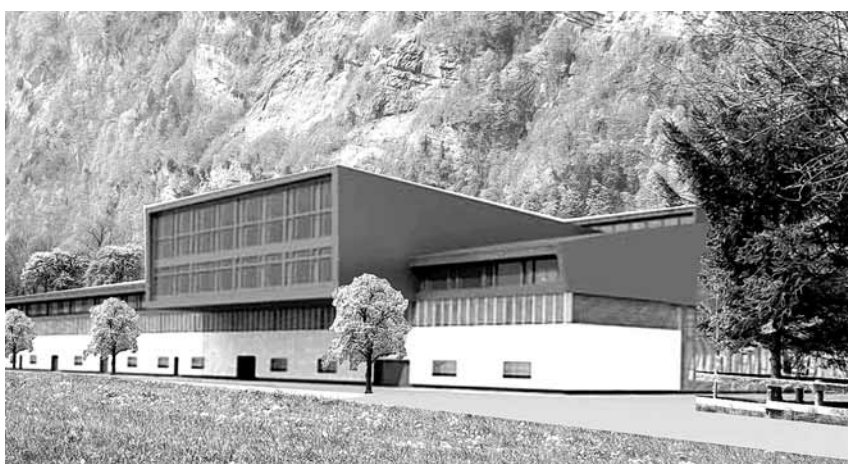
Es bleibt bei der Studie: So ähnlich wie in dieser Projektstudie der OceanSwiss hätte die Fischfarm in Mollis aussehen können.

sich die Standorte für eine Fischfarm eignen. Wer diese Privatpersonen sind und woher sie kommen, will van Vliet noch nicht verraten.